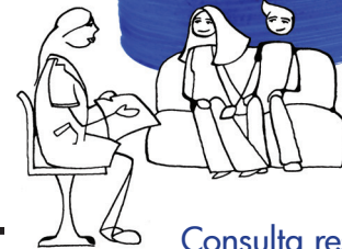
+ Consulta resultados