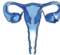
+ Valoración ecográfica